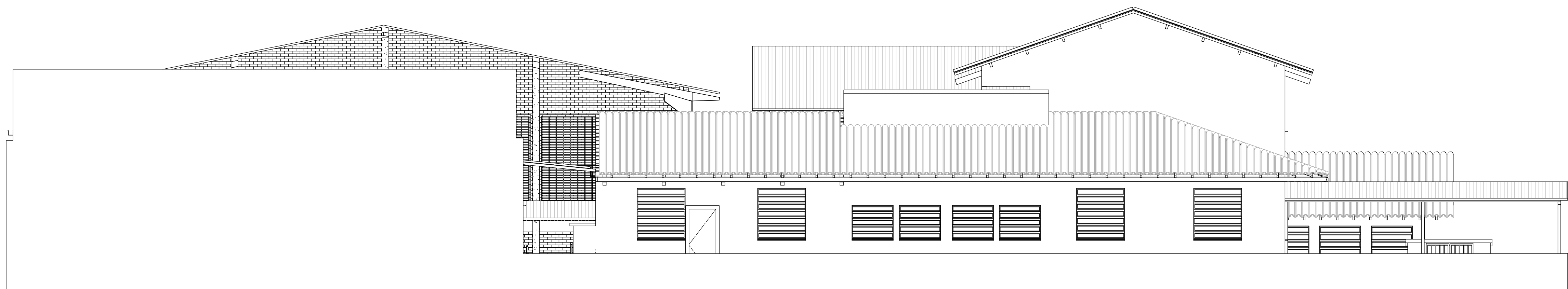
4 Fachada Sul 1: 50